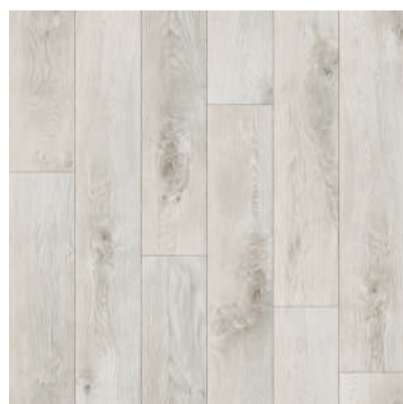
361 COLUMBUS board width 16,5 cm