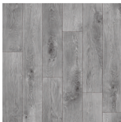
363 COLUMBUS board width 16,5 cm