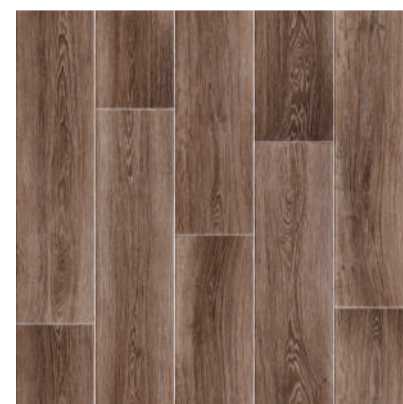
715 BLUES board width 20 cm