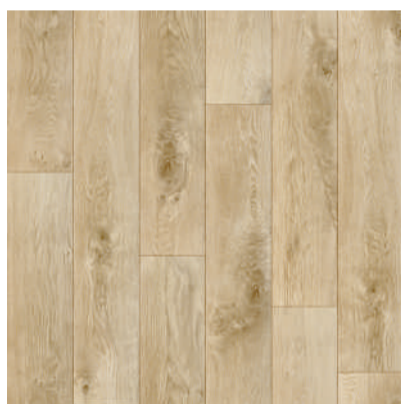
362 COLUMBUS board width 16,5 cm