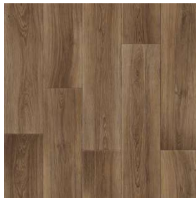
501 BORDEAUX board width 20 cm