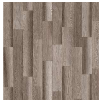
763 KLONDIKE board width 10 cm