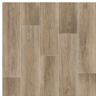
713 BLUES board width 20 cm