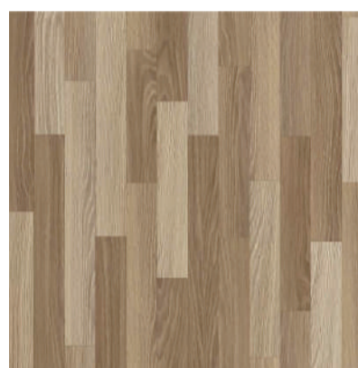
593 YORK board width 7,5 cm