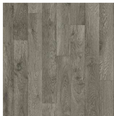
905 MEMPHIS board width 12,5 cm