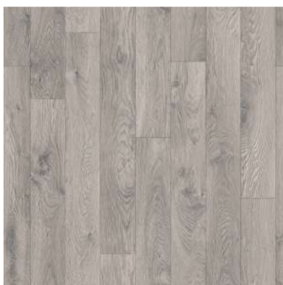
904 MEMPHIS board width 12,5 cm